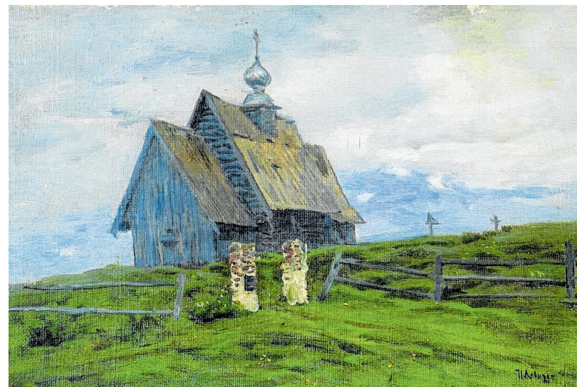
Isaak Lewitan: „Stiller Winkel“, Öl auf Leinwand.