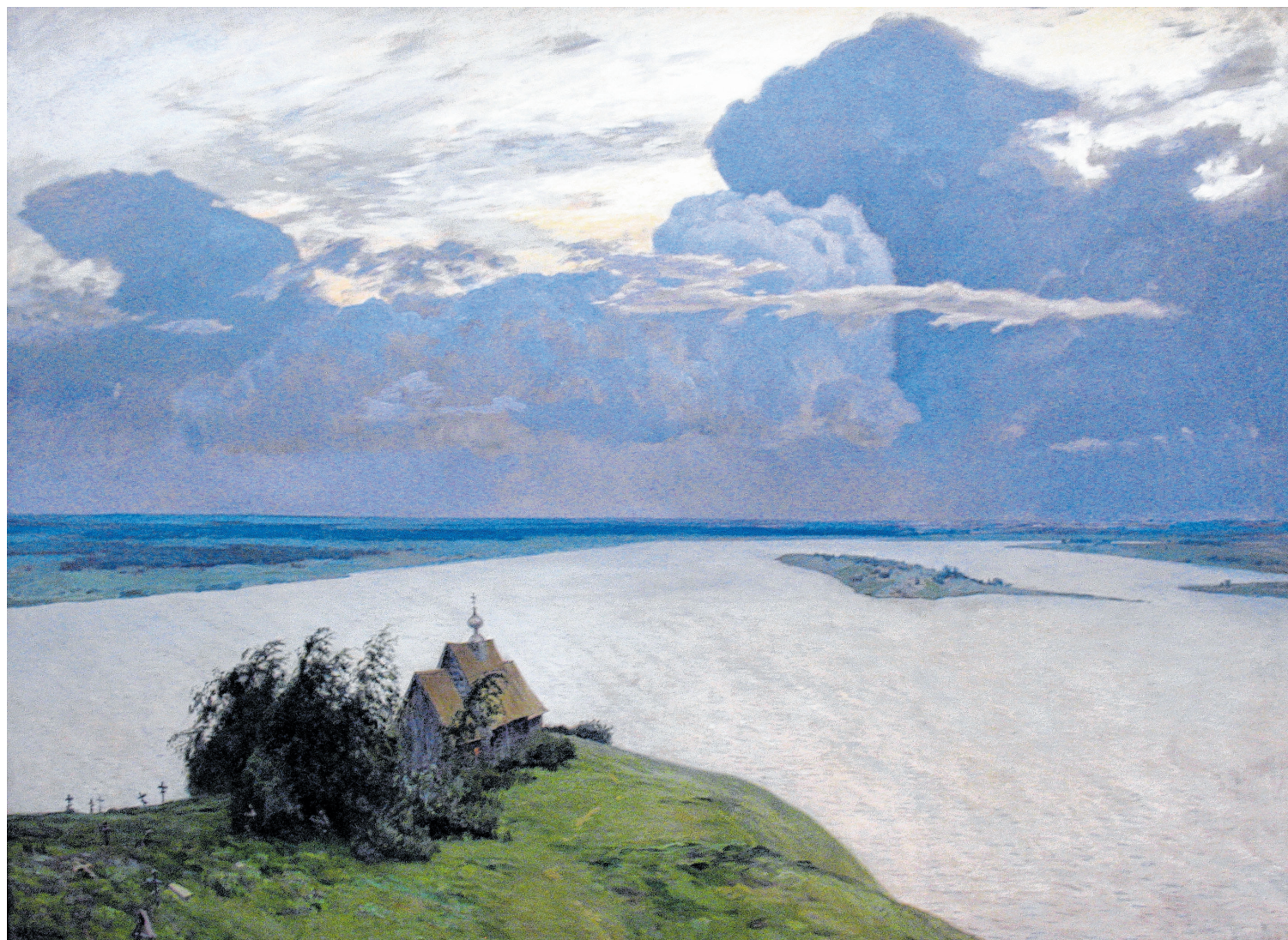
Neben den „Wolgatreidlern“ das wohl berühmteste Bild Lewitans: „Über der ewigen Ruhe“ (1894), Öl auf Leinwand.