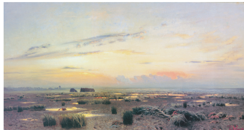
Isaak Lewitan: „Flussniederung am Abend“ (1882), Öl auf Leinwand.