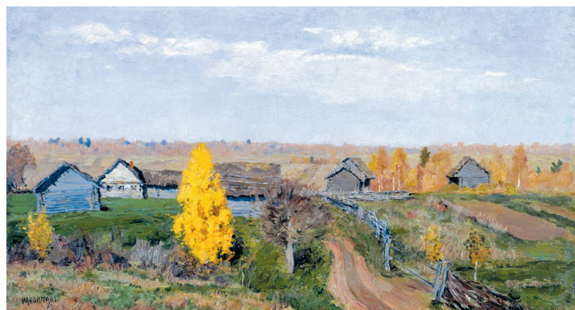
Isaak Lewitan: „Goldener Herbst. Im Dorf“ (1889), Öl auf Leinwand.

Nehring war während einer Wolgatreiderei in Kostroma auf Lewitan gestoßen. Dort hatte der russische Textilkaufmann Pawel Tretjakow (1832-1898), ein Förderer Lewitans, im 19. Jahrhundert seine Tuch- und Leinwandmanufakturen und seine Spuren als Kunstmäzen hinterlassen.