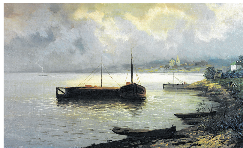
Isaak Lewitan: „Wolga“ (1888), Öl auf Leinwand.

Mit „Isaak Lewitan. Abendglocken an der Wolga. Russische Künstlerkolonien um 1900“ ist ein sehr lesens- und liebenswertes Buch eines Autors im 1700 Kilometer entfernten Ahrenshoop entstanden. Kunst kennt keine Grenzen.